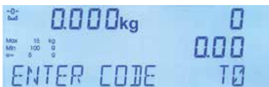
Display LCD retroiluminado