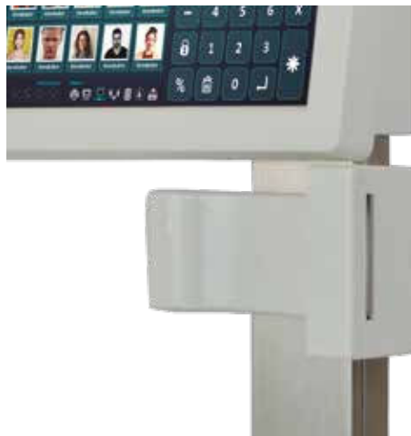
Fácil cambio de rollo de papel